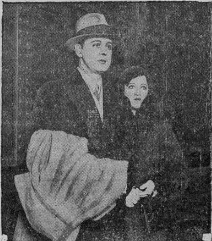
El Príncipe Sergio Mdivani al desembarcar en Chicago, fué recibido por la notable cantante de ópera Mary McCormick, con grandes manifestaciones de cariño. El Príncipe se acaba de divorciada de Pola Negri