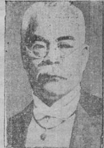
El premier Kuko Hamaguchi del Japón, a quien un asesino hirió en el estómago cuando tomaba un tren en Tokio, se encuentra entre la vida y la muerte, según el boletín de los médicos