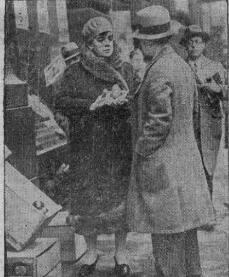
La señora Oscar Hammerstein, ex-esposa del famoso productor de ópera, en un tiempo celebrada y festejada por la sociedad y la nobleza de todo el mundo, aparece vendiendo manzanas en las calles junto con el gran número de desocupados de Nueva York