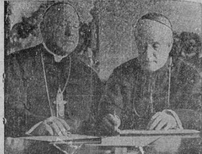
Su Eminencia el Cardenal O'Connell, a la izquierda (de Boston) y su Eminencia el Cardenal Hayes (de Nueva York), discutiendo la situación de los desocupados en los Estados Unidos. Los prelados se encuentran actualmente en Washington, asistiendo a la reunión anual de los ministros de la iglesia