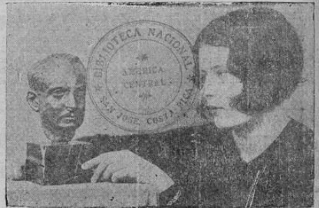
El Coronel James Fitzmaurice, uno de los tres aviadores que cruzaron el Atlántico en el aeroplano "Bremen", se embarcará en una nueva aventura matrimonial al casarse con la Baronesa Alemana Bárbara von Kalkreuth, quien aparece en la fotografía. Fitzmaurice está actualmente divorciándose de su primera esposa